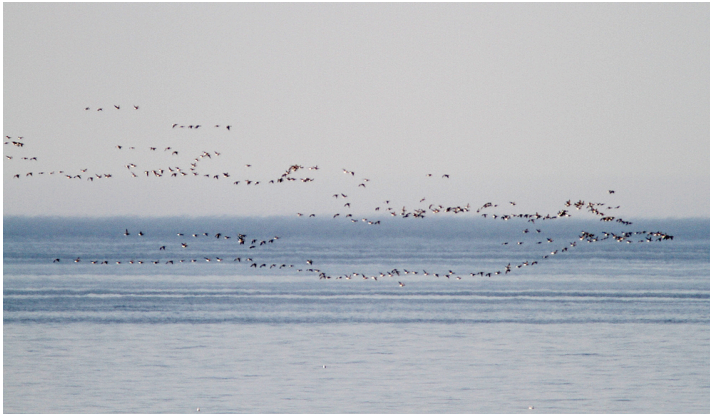
Ringgås på vårtrekk forbi Lista Fyr og sjøfuglbua